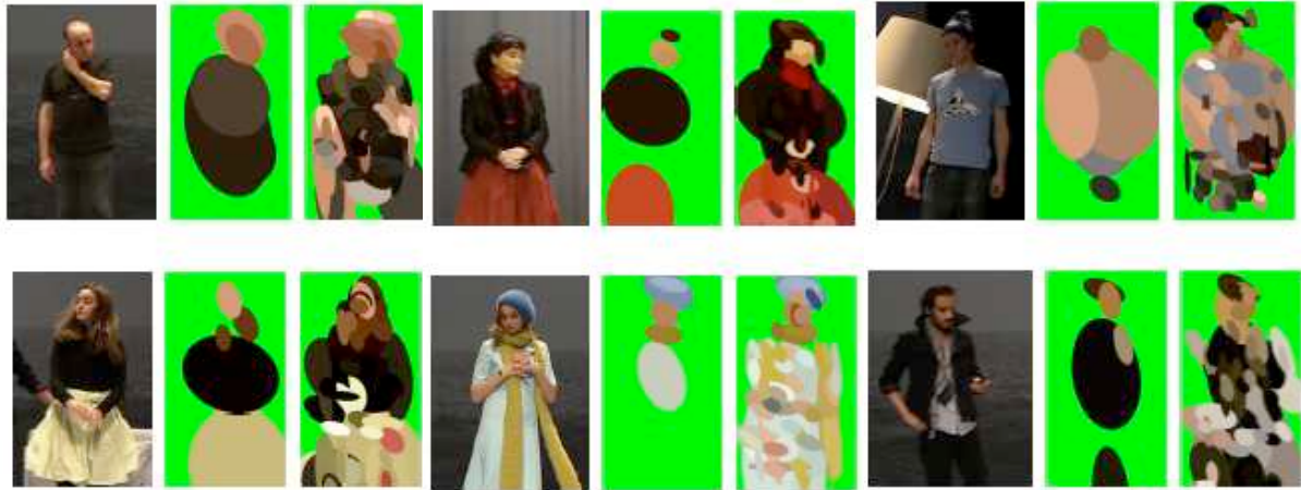
Figure 4: Indexation visuelle de 6 acteurs pendant les répétitions de “A l’ouest” 30 de Nathalie Fillion. Mise en scène de Nathalie Fillion. Coproduction - Théâtre du Rond-Point, Célestins, Théâtre de Lyon, Cie Théâtre du Baldaquin, AskUs , Le Gallia Théâtre-Saintes. Coproduction - Théâtre du Rond-Point, Célestins, Théâtre de Lyon, Cie Théâtre du Baldaquin, AskUs , Le Gallia Théâtre-Saintes.