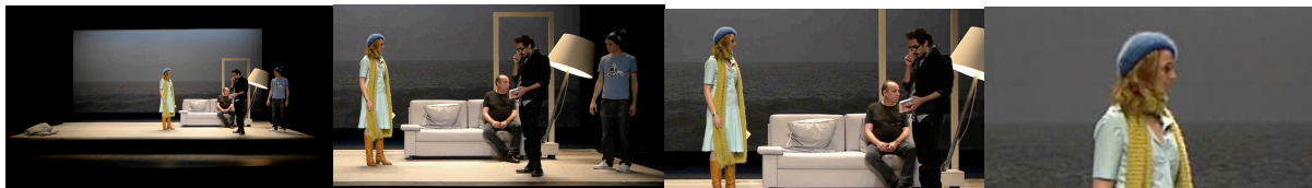
Figure 5: Scénoptique : trois recadrages d’une captation HD des répétitions de “A l’ouest” dans la mise en scène de Nathalie Fillion. Coproduction - Théâtre du Rond-Point, Célestins, Théâtre de Lyon, Cie Théâtre du Baldaquin, AskUs , Le Gallia Théâtre-Saintes. Coproduction - Théâtre du Rond-Point, Célestins, Théâtre de Lyon, Cie Théâtre du Baldaquin, AskUs , Le Gallia Théâtre-Saintes.