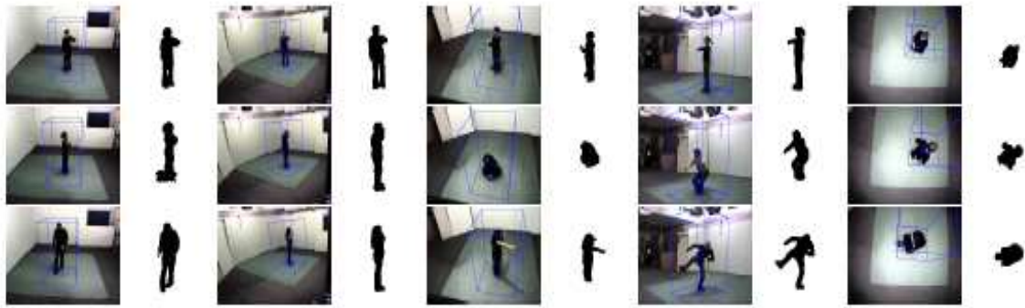
Figure 5. Camera setup and extracted silhouettes: (Top) the action “watch clock” from the 5 different camera views. (Middle and bottom) sample actions: “cross arms”, “scratch head”, “sit down”, “get up”, “run”, “walk”, “wave”, “punch”, “kick”, and “pick up”. Volumetric exemplars are mapped onto the estimated interest regions indicated by blue box.

Figure 2: Exemple de 11 actions simples reconnaissables par ordinateur 21 . INRIA Xmas Motion Acquisition Sequences (IXMAS) 2 : multiview dataset for view-invariant human action recognition.