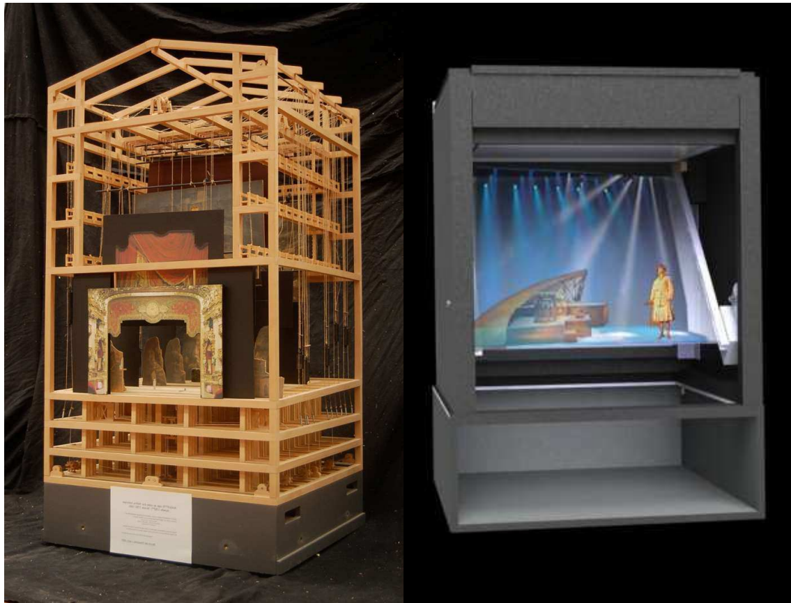
Figure 1 : De la maquette traditionnelle à la maquette virtuelle

L'objectif est de permettre à chacun d'utiliser la maquette à partir de ses outils ou interfaces métier. Le concepteur des plans doit pouvoir y importer les fichiers 3D qu'il a réalisés avec son logiciel habituel ; le chef plateau doit être libre de définir l'interface adéquate qui lui permettra de manipuler les éléments scénographiques dans la simulation ; le metteur en scène et le scénographe définiront leurs exigences au niveau du rendu et de la manipulation de ces mêmes éléments ; le cintrier doit pouvoir piloter les perches virtuelles avec son pupitre habituel, etc. Paradoxalement, la maquette sera tangible et accessible selon le point de vue de chaque usage. La première dimension implique de pouvoir manipuler directement les éléments simulés avec des interfaces adéquates. C'est un enjeu d'interaction homme-machine (IHM) dans le cas particulier d'un rendu 3D stéréoscopique. La seconde dimension suppose de pouvoir utiliser la maquette virtuelle comme une scène pilotable par des interfaces de contrôle métiers extérieures (enjeux de déport des interfaces, de portabilité de la maquette, de point de vue stéréoscopique). Habituellement, la notion de réalité augmentée fait référence à un espace physique dans lequel on juxtapose des éléments visuels et sonores permettant d'accéder à des informations virtuelles à propos de l'espace concerné. Ici, il s'agit de doter d'extensions physiques des éléments virtuels afin de matérialiser des manipulations. Le passage de