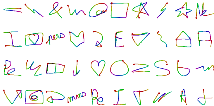
FIG. 1 – Exemples de gestes – ILGDB groupe 1 (gestes libres).

mono-stroke, appartenant à 21 classes, qui ont été saisis par 38 scripteurs dans un environnement immersif. Cette base de donnée est très intéressante pour plusieurs raisons. Tout d'abord, les gestes sont ordonnés chronologiquement suivant leur ordre de saisie ce qui permet de voir l'évolution de la manière de dessiner des scripteurs avec le temps. Ensuite, les fréquences des différentes classes varient, de 5 à 17 exemples par classe (par scripteur). Enfin, pour toute une partie de la base, les gestes des 21 classes ont été définis par les utilisateurs eux-mêmes. Ces caractéristiques font que cette base de données contient des gestes très réalistes et représentatifs de l'utilisation d'un classifieur en-ligne. En revanche, l'inconvénient de cette base est son faible nombre de gestes par scripteur (moins de 180) et par classe pour chaque scripteur (entre 5 et 17 gestes). Des exemples des gestes inventés par les scripteurs sont présentés Figure 1.