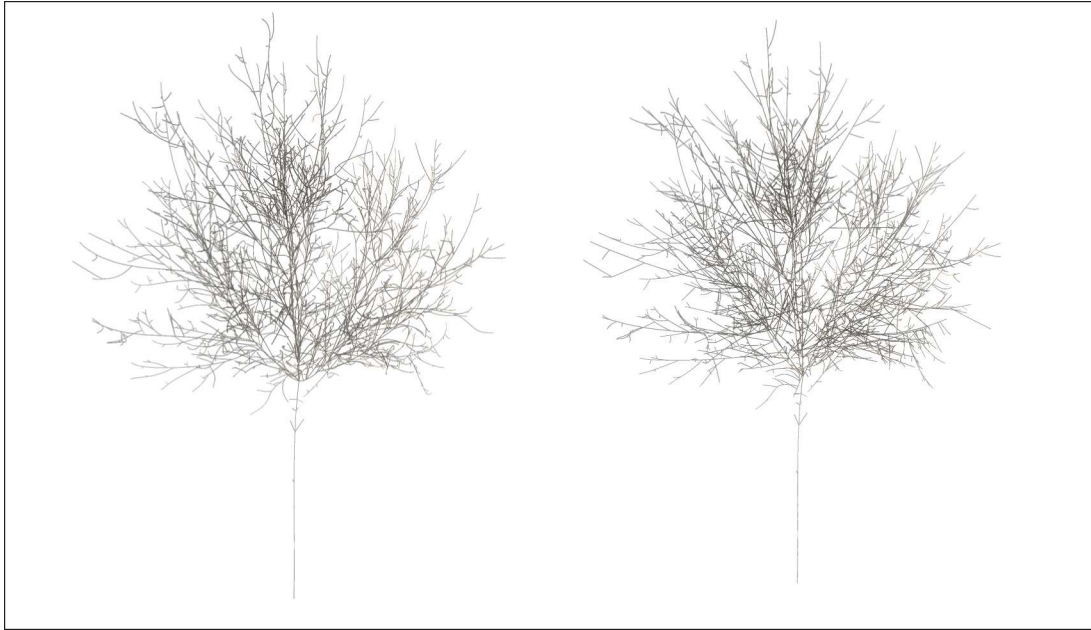
Figure 3: Exemple de reconstruction d'une plante (Noyer numérisé [SRG97]) avec et sans les coefficients différentiels : à gauche compression sans pertes (74 % du modèle original), à droite, avec pertes (61 % du modèle original).