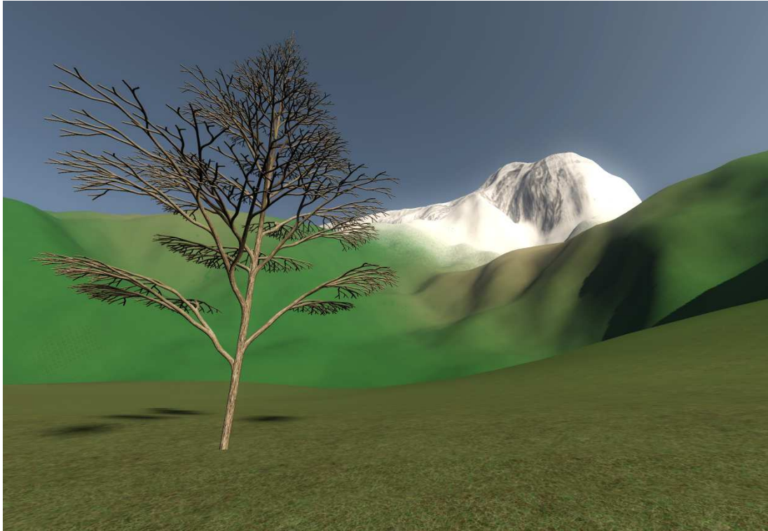
Figure 5: Exemple d'utilisation de cylindres généralisés pour le rendu de plantes (ici un arbre généré par L-système).