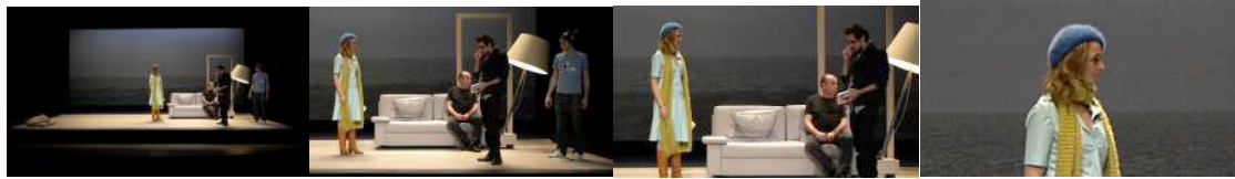
Figure 2: Scénoptique : trois recadrages d'une captation haute définition sur la scène des Célestins.