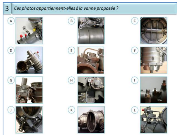
Figure 3 : Écran de consignes - épreuve III