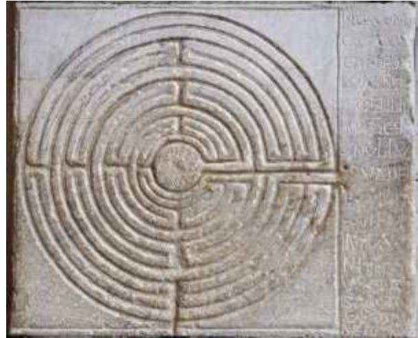
Labyrinthe digital situé à l'entrée de la cathédrale de Lucques en Italie

Une autre question va surgir chez les enfants les plus grands : mais comment sortir d'un labyrinthe inconnu ? C'est-à-dire de tous les labyrinthes du monde avec le même algorithme ? Est-ce que « avance tout droit puis prends à droite dès que possible » est un bon algorithme pour tous les labyrinthes ? Eh bien non ! Car on risque fort de tourner en rond... D'où peut-être l'idée de semer des petits cailloux sur le chemin ?