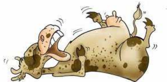
Ce qui arrivera en cas de bug !

On fabriquera des petites cartes à jouer en découpant un vieux carton en petits carrés avec les mots « avancer », « gauche », « droite ». Et on lui donnera une séquence de ces cartes qui sera son « algorithme ». Il devra exécuter cet algorithme sans « réfléchir » (gare au mur - et à la rigolade - s'il y a un bug !). Ensuite on aura sûrement envie de ne pas répéter « avance d'un pas, avance d'un pas, avance d'un pas » mais « avance de trois pas ». Donc l'instruction aura une valeur variable