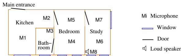
FIGURE 2 – Position des microphones dans l'appartement domus

Dans cette étude les ordres domotiques ont été définis en utilisant une grammaire (Figure 1). Nos précédentes études ont montré que les utilisateurs préfèrent des phrases courtes à des phrases plus longues (et naturelles) pour piloter leur environnement (Portet et al. , ress ). Chaque ordre est classifié dans une des catégories suivantes : commande initiale, commande d'arrêt, appel de détresse. A l'exception des appels de détresse, toutes les commandes commencent par un mot clef permettant de lever l'ambiguïté sur les phrases prononcées. Dans nos expériences, le mot clef est Nestor (qui représente l'entité intelligente de l'habitat) :