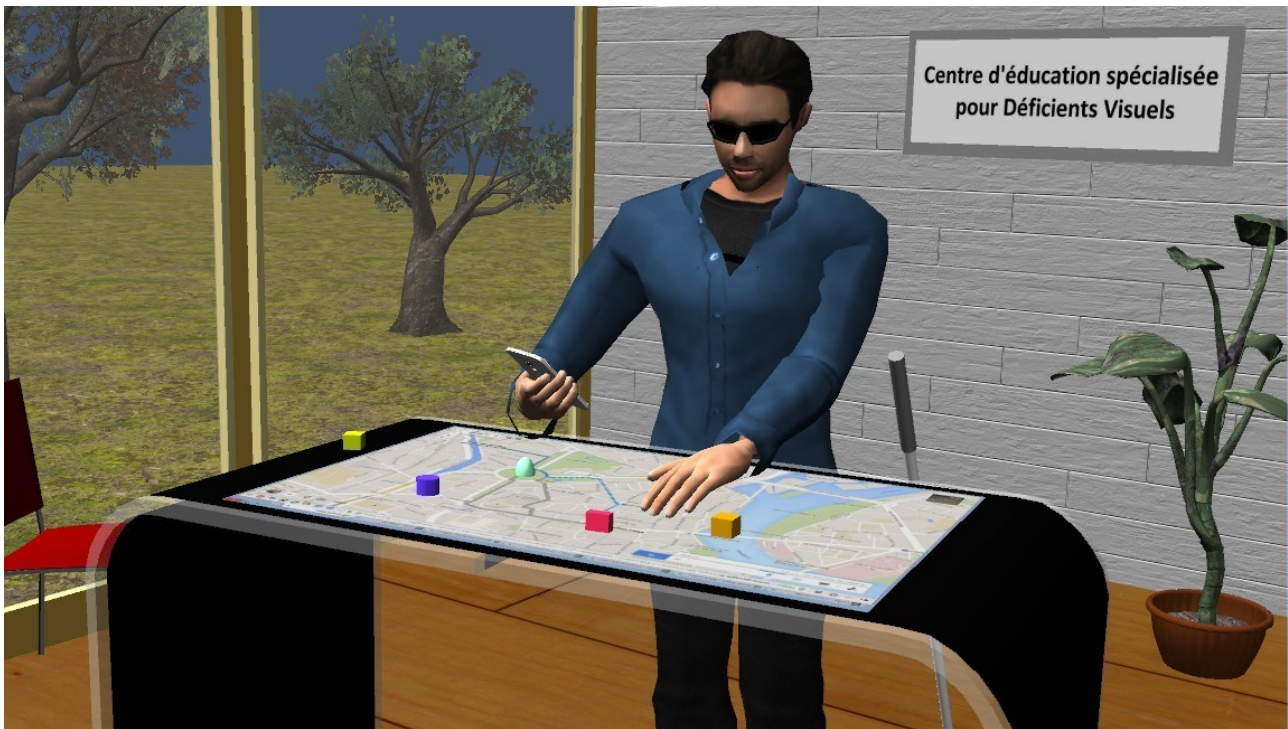
Figure 3: Projet AccessiMap : exploration tactile, tangible et multi-supports (par ex depuis son smartphone personnel) de données spatiales