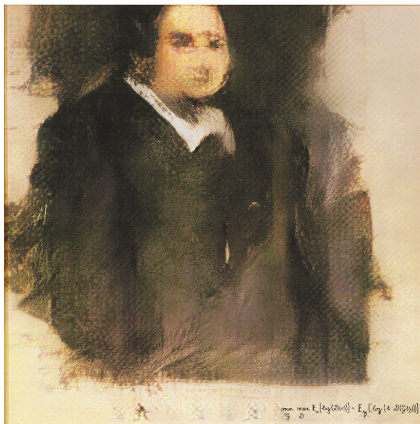
Le Portrait d' Edmond de

[caption id="" align="aligncenter" width="411"]