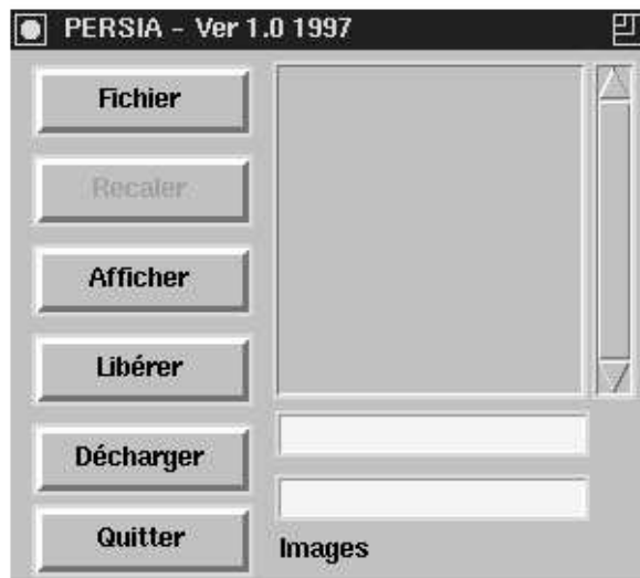
FIG. 1.1 – Menu Principal de PERSIA

Une fois les fichiers installés, le programme peut être lancé par la commande: persia . Cette commande affiche automatiquement le menu principal du logiciel (voir FIG. 1.1).