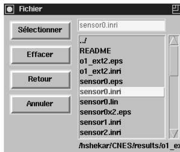
FIG. 1.2 – Menu de fichier

et une case où le nom du dernier fichier sélectionné est affiché. Un ascenseur permet de parcourir le répertoire actuel.