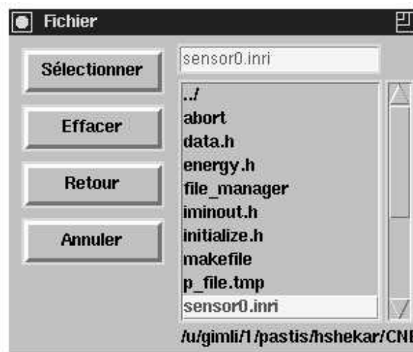
FIG. 1.2 – Menu de fichier

et une case où le nom du dernier fichier sélectionné est affiché. Un ascenseur permet de parcourir le répertoire actuel.