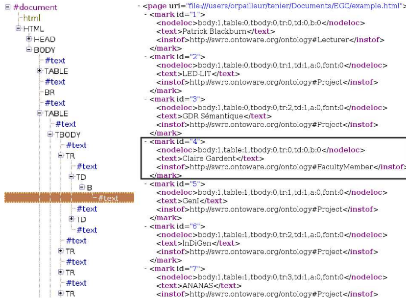
FIG. 2 – Arbre DOM et annotations primaires issues du marquage

La figure 2 présente un exemple de marquage à partir de la page présentée en figure 1 et de l'ontologie SWRC 1 , qui modélise notamment les personnes, organismes et projets d'une équipe de recherche. L'ensemble de ces éléments marqués sont des annotations primaires qui jouent ainsi le rôle de corpus pour l'algorithme d'apprentissage.