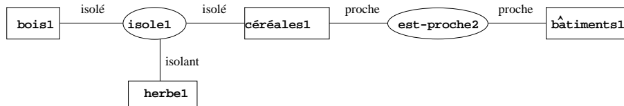
FIG. 2 – Graphe associé à une partie du chorème de la figure 1.

des deux agronomes. Il conduit également à des modifications concrètes du chorème, tracées soit par M1 soit par M2 . La dite reconception du chorème s’actualise donc dans des traçages, au crayon de papier, sur le chorème initial.