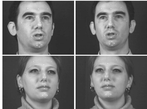
FIG. 2: Images en stéréovision de deux locuteurs, 15 marqueurs sont peints sur le visage de chaque locuteur.