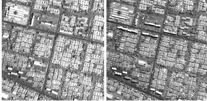
Fig. 1. Couple d'images Quickbird originales

Les couples d'images utilisées représentent la ville d'Abidjan, en Côte d'Ivoire, et ont été prises à 6 mois d'intervalle. Les effets de stéréoscopie et de changement d'ombres portées sont nettement visibles à travers la présence de bâtiments à forte élévation dans la partie centrale de l'image.