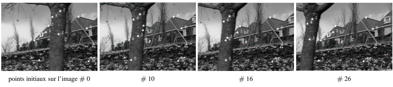
points initiaux sur l'image # 0 # 10 # 16 # 26