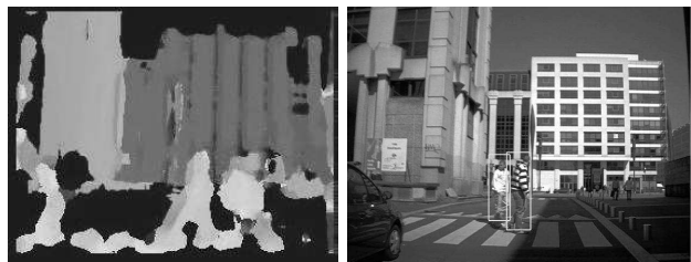
Fig. 1. Carte de disparité et résultat de la détection de piéton

La disparité est la différence de position entre un point de l'image de la première caméra et son correspondant sur l'image de la deuxième caméra. L'information de disparité d , couplée aux paramètres physiques de la paire stéréoscopique - base de la paire B et distance focale des caméras f - permet d'obtenir la profondeur P du point considéré selon la formule P = B.f/d .