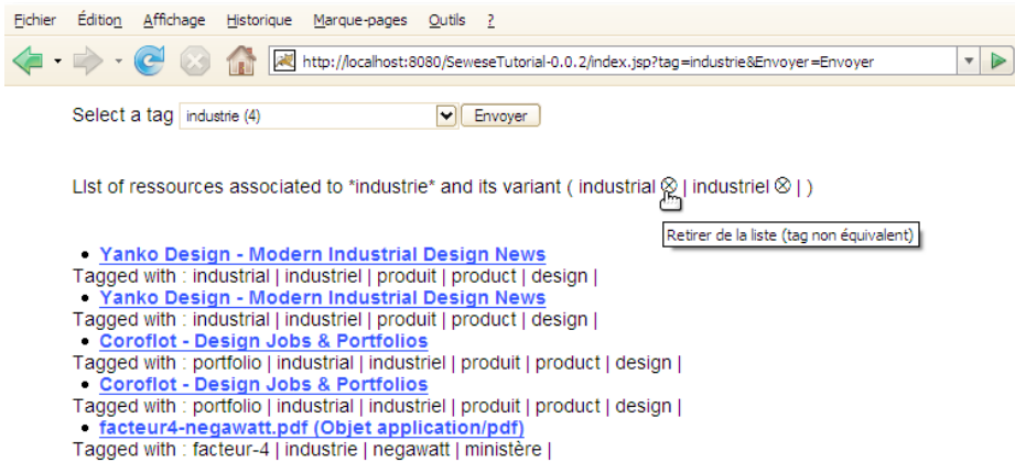
FIGURE 2 – Exemple de fonctionnalité sémantique suggérée par l’interface pour retirer un tag non-équivalent

d’ontologies plus formelles lorsque cela est pertinent pour nos usagers. Notre but est de construire en premier lieu des ontologies légères qui s’apparenteraient aux thésaurus tels que modélisés par le schéma SKOS, et qu’il est toujours possible ensuite de rapprocher d’autres ontologies, formelles ou non, soit en adaptant des techniques d’alignement (Euzenat & Shvaiko, 2007), soit en les mettant en perspectives sous des points de vues différents et explicités dans l’interface, à la manière de (Cahier et al. , 2007) qui ont intégré le thésaurus GEMET 10 comme un des points de vue de l’ontologie sémiotique mise en œuvre dans le système CartoDD 11 .