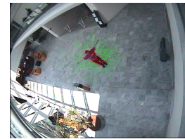
FIG. 2 – Sélection des exemples d’apprentissage suivant une distribution Gaussienne multivariée.

Outre la modularisation, nous proposons également une nouvelle approche de sélection des exemples d’apprentissage. Afin de rendre la zone spatiale d’apprentissage dynamique, nous suggérons d’effectuer le tirage des exemples en respectant une Gaussienne multivariée dont la matrice de covariance est construite de façon à tirer autant de pixels dans le rectangle objet qu’à l’extérieur (cf. Figure 2). Ce type d’échantillonnage permet de régulariser l’apprentissage du fond et d’anticiper sur les changements brutaux qui peuvent intervenir.