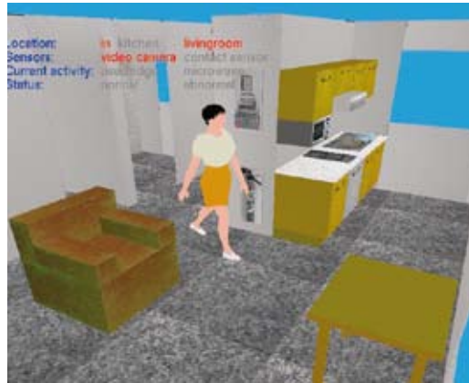
Fig. 4 et 5 : à gauche, la personne représentée est détectée en trois dimensions par son mouvement et son gabarit. L'image de droite correspond à l'interprétation de celle de gauche : la personne réelle est représentée par un modèle 3D de personne et replacée dans un modèle 3D du lieu observé par les caméras.

concerne l'apprentissage incrémental (au fur et à mesure du traitement des informations) de modèles sémantiques d'activités. Sur quelles données d'apprentissage peut-on s'appuyer? Quelles sont les parties des modèles connus à modifier? Et surtout, comment garantir le lien entre l'information apprise par le logiciel