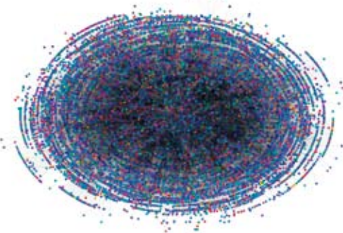
Fig. 1 : Dans un réseau pair-à-pair, chaque ordinateur est à la fois client et serveur. Une fois connecté au réseau, via un logiciel commun, chacun peut participer aux tâches communes, par exemple échanger des fichiers de musique. Sur ce graphique, les points représentent des machines autonomes, et les lignes les communications entre ces machines.

Maps, l'encyclopédie Wikipedia, les profils de personnes d'un site de rencontre comme Meetic. Une très large majorité des sites proposant du contenu sur le web sont aujourd'hui articulés autour d'un système de gestion de bases de données (SGBD) relationnel, un des grands succès de l'informatique de la fin du siècle dernier (voir l'encadré).