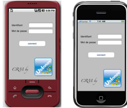
Figure 2. Application GRC, écran de connexion sur Android et iPhone.

Phase 2, génération de code. Les générateurs de code ont été développés sous la forme de gabarits Acceleo. Dans le cadre de cette démonstration, ce sont près de 1500 lignes de code qui sont générées. Après l'avoir modélisée et générée, l'application est entièrement fonctionnelle et n'a nécessité aucun ajout en termes de développement.